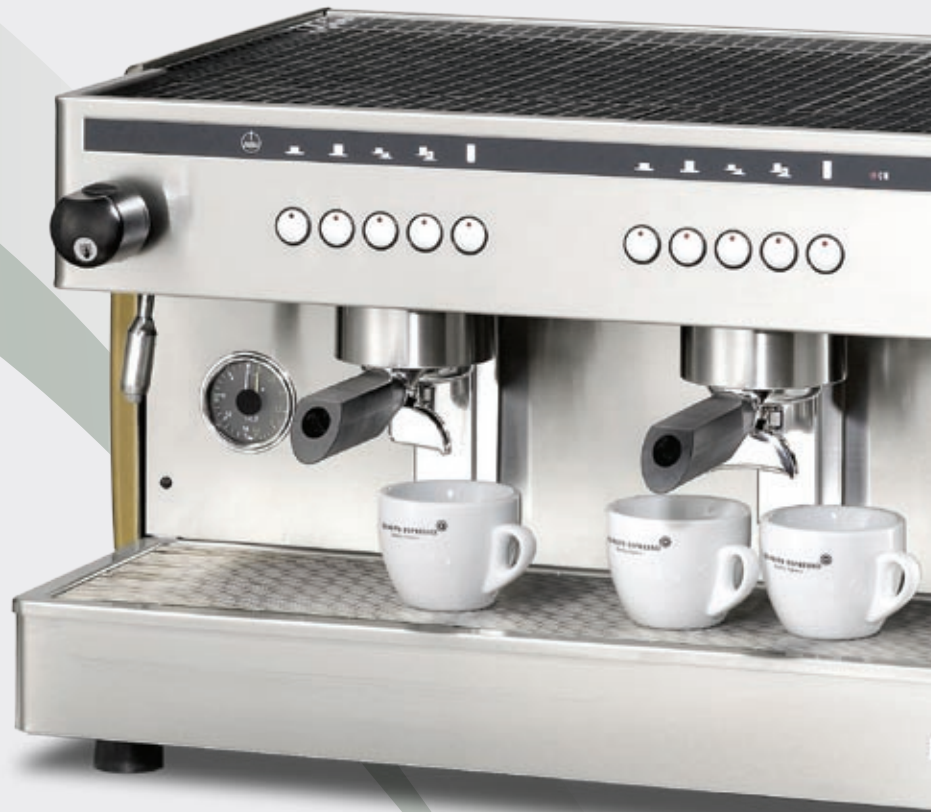
Semiautomatic 2 groups