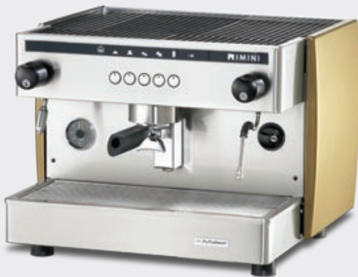
Electronic 1 group